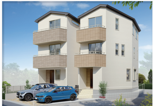
◎設備・仕様 ●完成予想図・図面を基に描き起したもので、実際とは多少異なります。

【物件概要】●住居表示 / 墨田区立花3丁目15番17号●交通 / JR総武線「平井」駅徒歩13分、東武亀戸線「東あずま」駅徒歩2分、「小村井」駅徒歩8分●土地権利 / 所有権●用途地域 / 準工業地域●その他 / 17m第3種高度地区、準防火地域●建ぺい率 / 80%●容積率 / 200%●土地面積 / B号棟: 75.21㎡ (22.75坪)●延床面積 / B号棟: 116.73㎡ (35.31坪)●構造 / 木造3階建●接道 / 南西側約3.6~3.7m公道●設備 / 都市ガス・公営水道・公共下水・東京電力●販売総戸数 / 2棟●完成 / 令和3年10月末予定●引渡 / 令和3年11月末予定●建築確認番号 / B号棟第R03SHC105702号 (令和3年4月27日付) ※間取図面と現況が異なる場合は現況を優先とします。