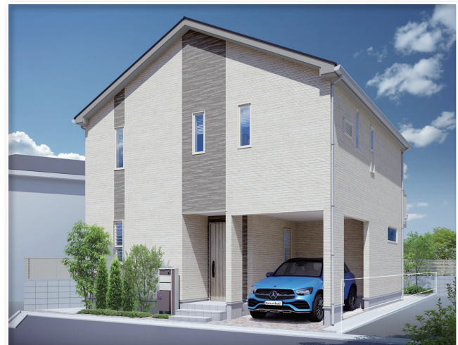
●完成予想図:図面を基に描き起したもので、実際とは多少異なります。

【物件概要】●住居表示 / 練馬区向山2丁目3番11号 (旧住居表示) ●交通 / 都営大江戸線「豊島園」駅徒歩7分・西武池袋線「中村橋」駅徒歩11分・都営大江戸線・西武池袋線「練馬」駅徒歩12分 ●土地権利 / 所有権 ●用途地域 / 第1種低層住居専用地域 ●その他 / 第1種高度地区、準防火地域、日影規制有、敷地面積最低限度80㎡ ●建ぺい率 / 50% ●容積率 / 100% ●土地面積 / C号棟:80.05㎡ (24.21坪) ●延床面積 / C号棟:93.36㎡ (28.24坪) ●構造 / 木造2階建 ●接道 / 北側約4.9~5.0m公道 (セットバック後) ●設備 / 都市ガス・公営水道・公共下水・東京電力 ●販売戸数 / 1棟 ●完成 / C号棟:令和4年1月末完成予定 ●建築確認番号 / C号棟:第R03SHC118458号 (令和3年9月6日付) ●間取図面と現況が異なる場合は現況を優先とします。