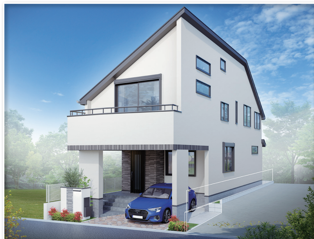
●完成予想図:図面に基に描き起したもので、実際とは多少異なります。