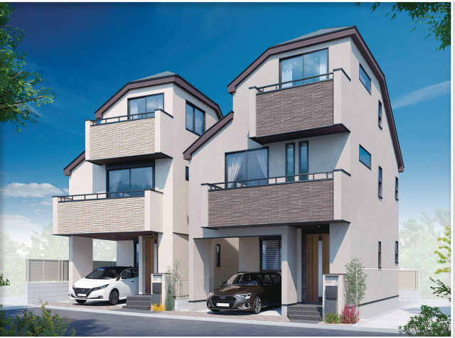
●完成予想図・図面に描き起したもので、実際とは多少異なります。